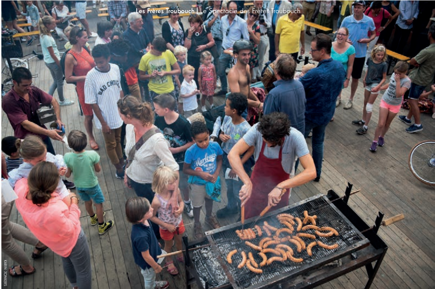
Les Frères Troubouch | Le Spectacle des Frères Troubouch