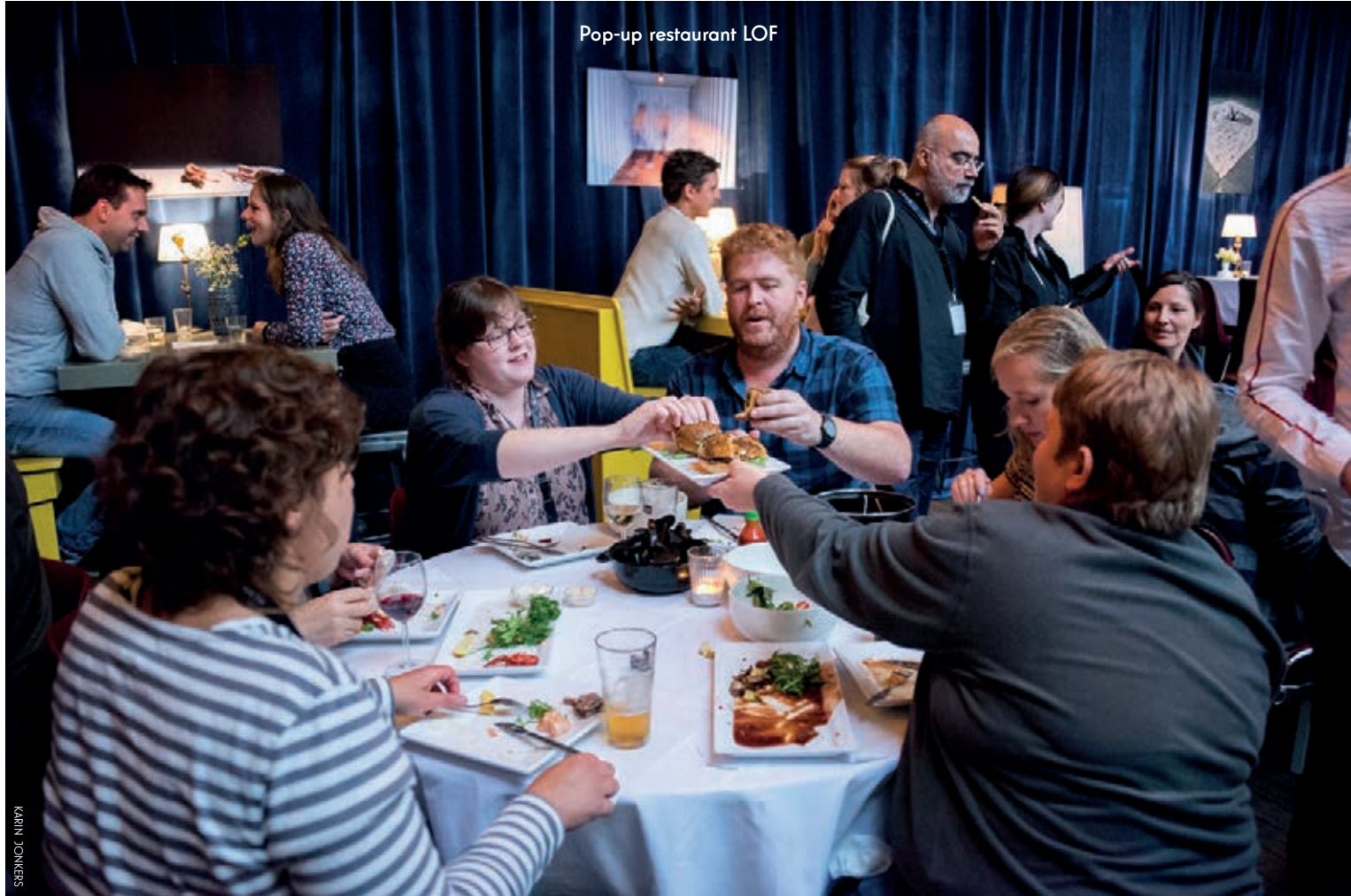
Pop-up restaurant LOF