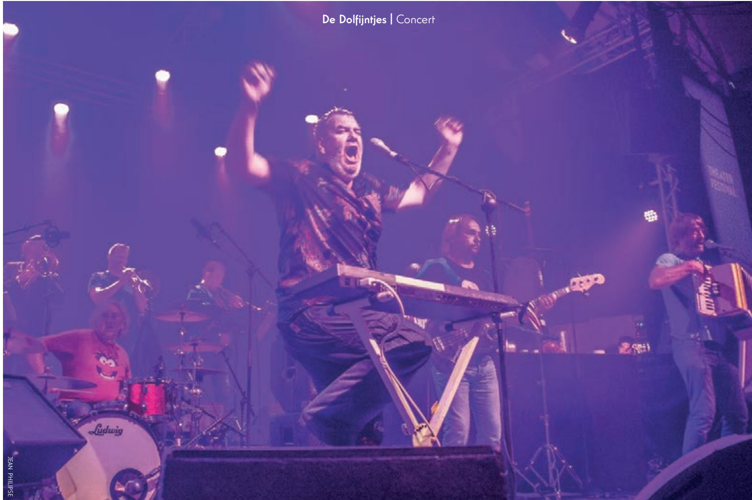
De Dolfijntjes | Concert